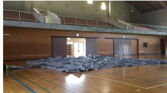
本体を広げ、送風約2分30秒で展張