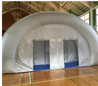
正面・入り口幕を巻き上げ