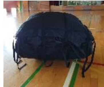
設置前折り畳みの状態