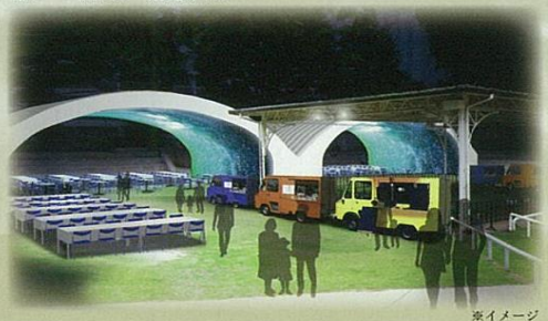
憩いの広場 (相撲場)